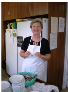
Labi, ka var pasmaidīt pie trauku mazgāšanas!