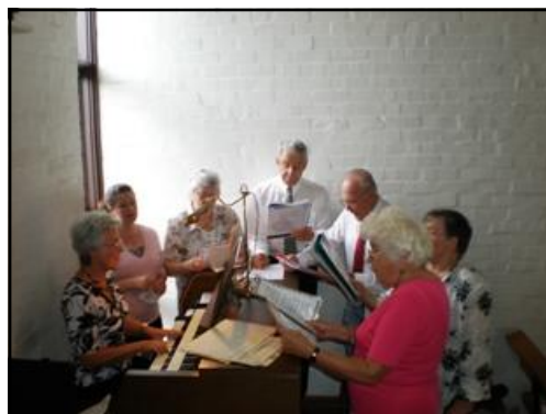
Ansamblis dzied dievkalpojumā