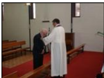
Amata zīmes uzlikšana